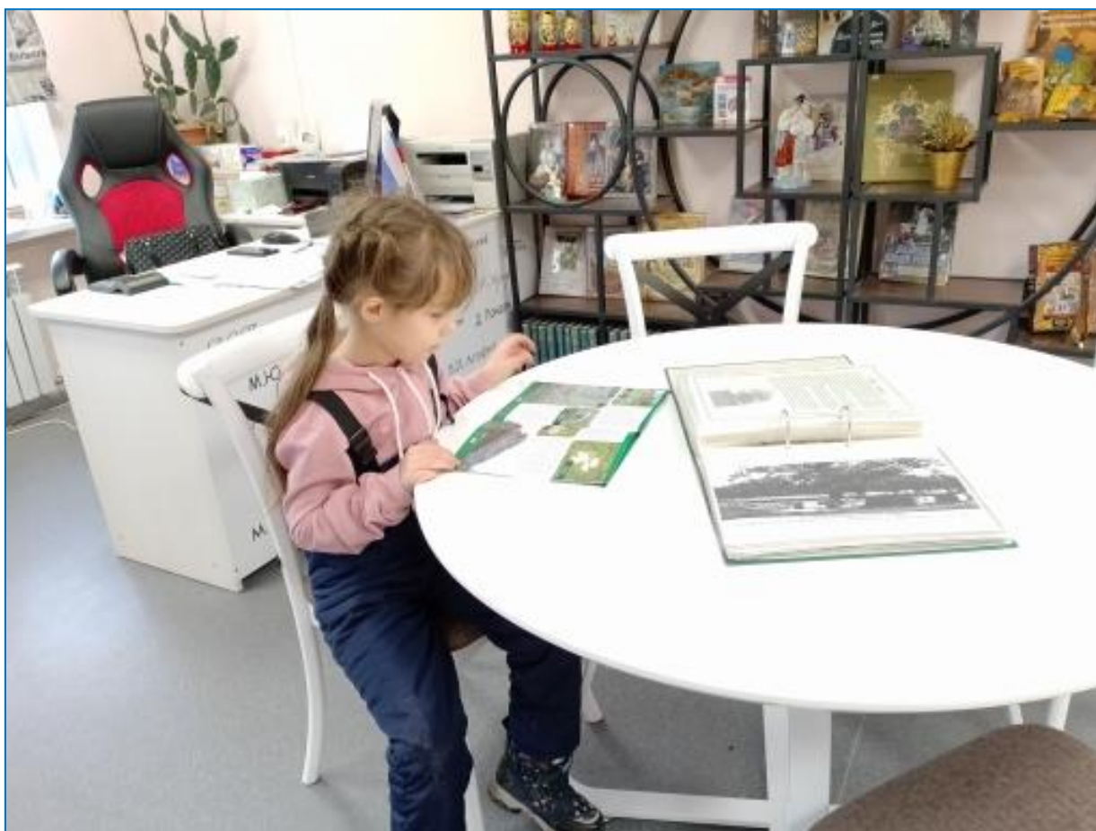
Рис.3 Изучаю книгу «По следам I Мировой войны» про захоронения воинов Русской Императорской армии в Нестеровском районе