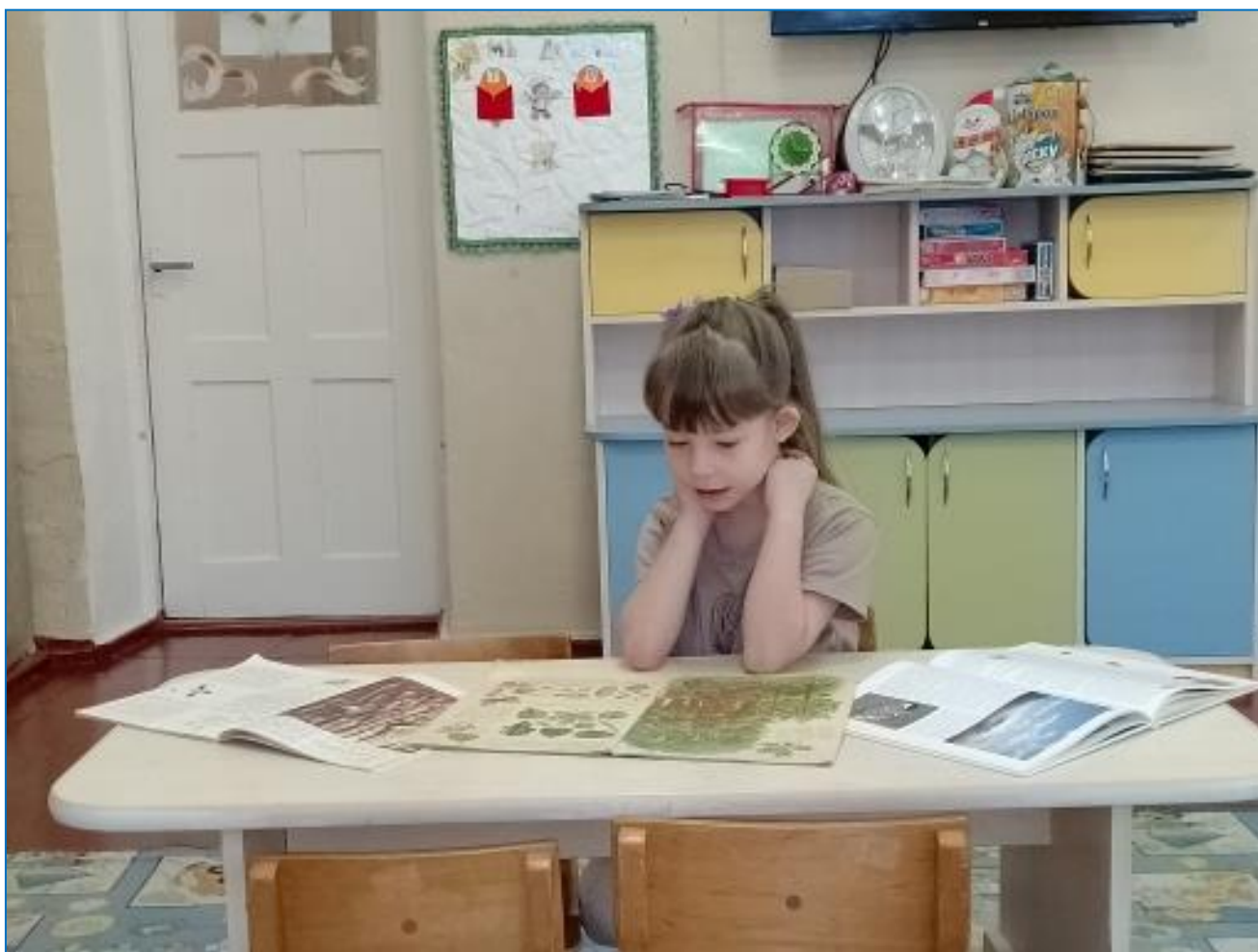
Рис. 2 Изучаю книги о дубе