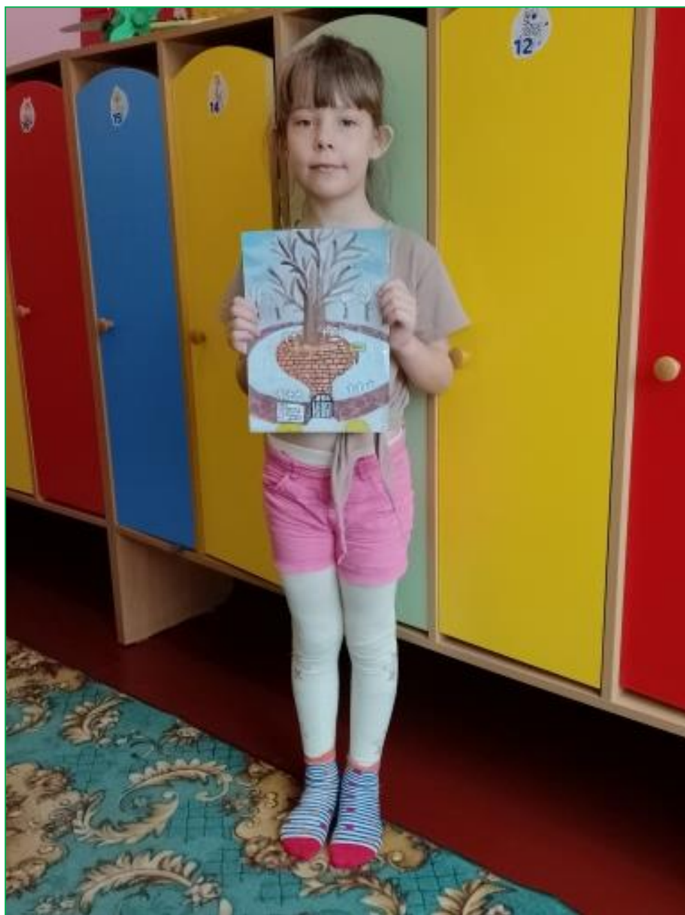
Рис. 7 Мой рисунок