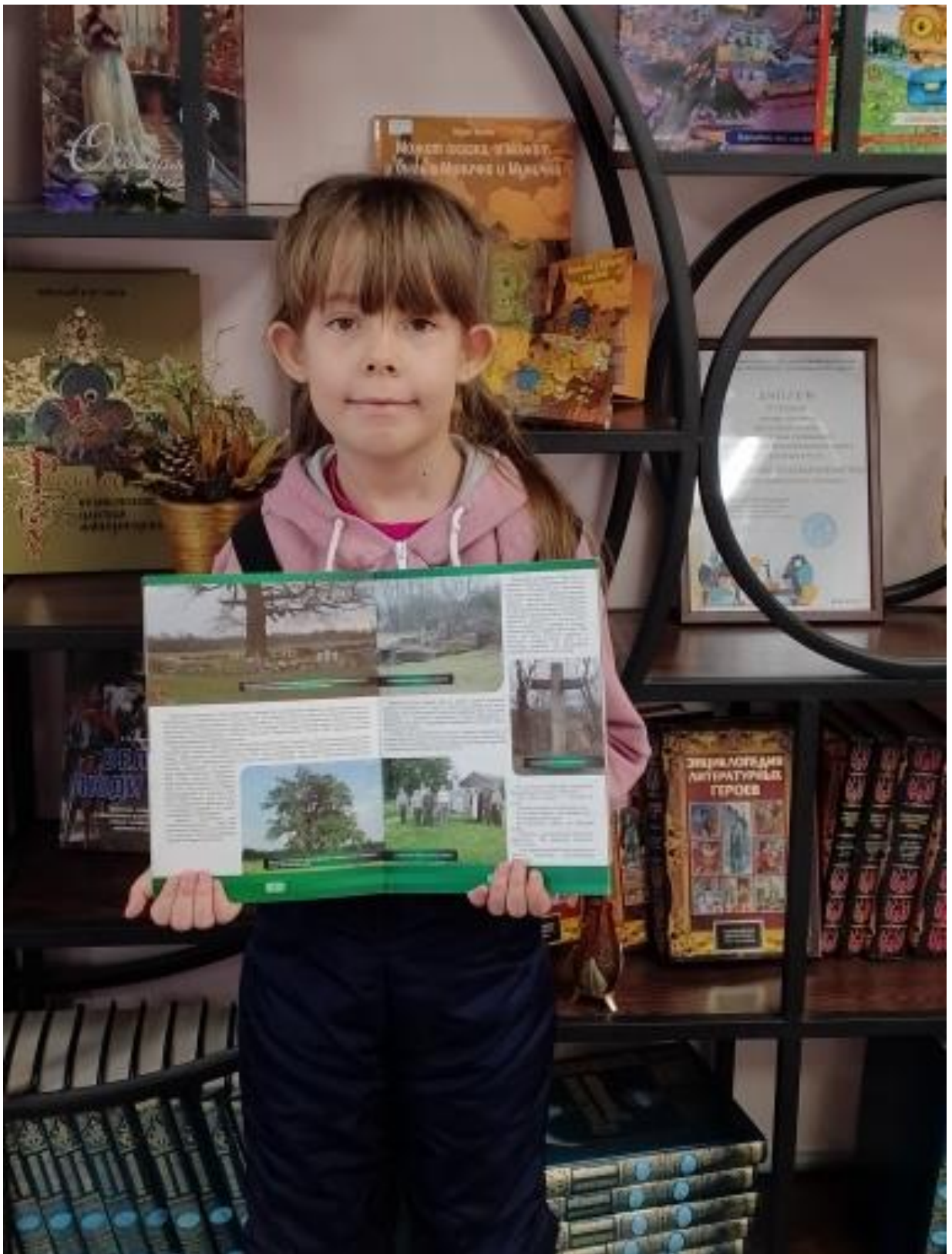
Рис. 4 В этой книге есть сведения и про наш дуб