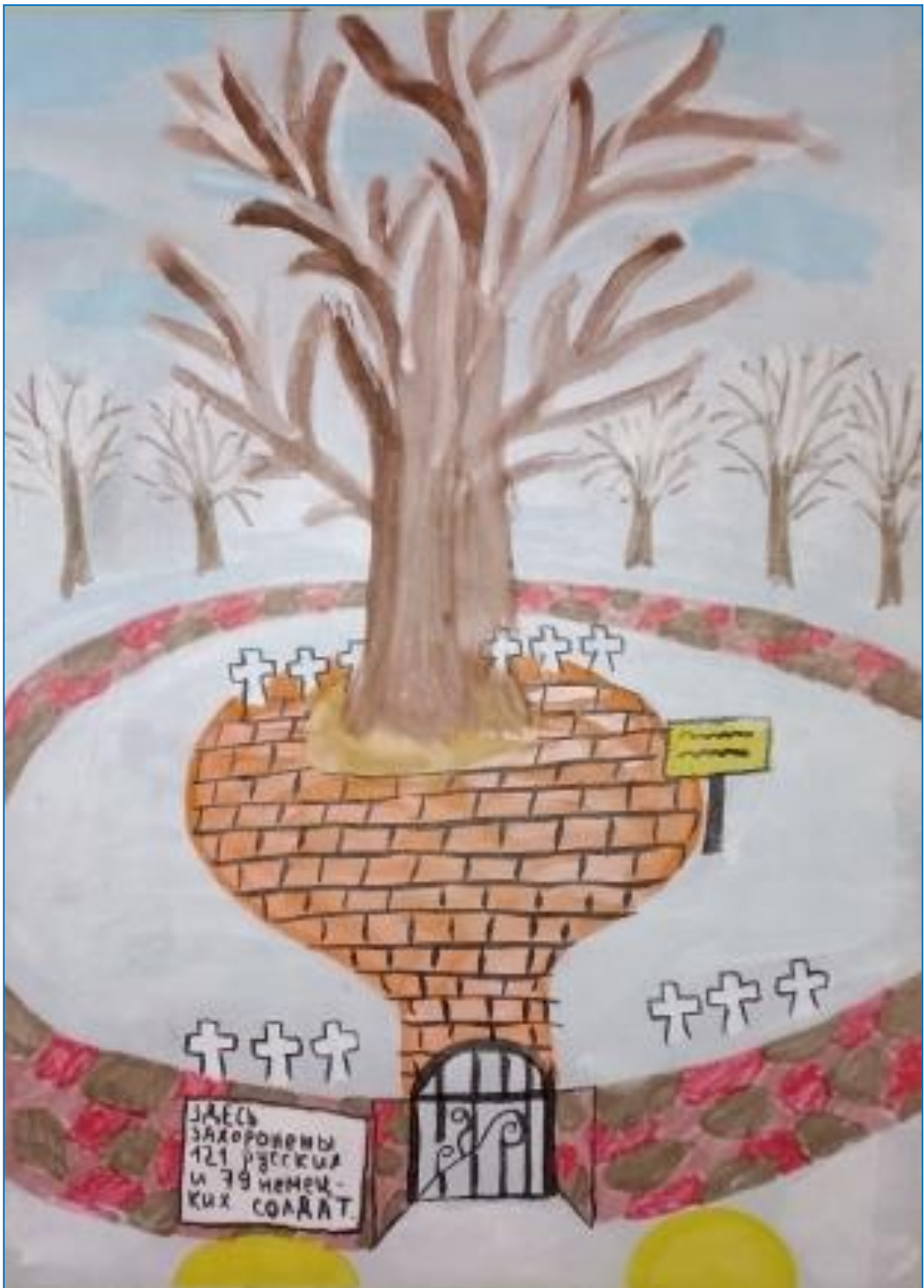
Рис. 8 Наш дуб