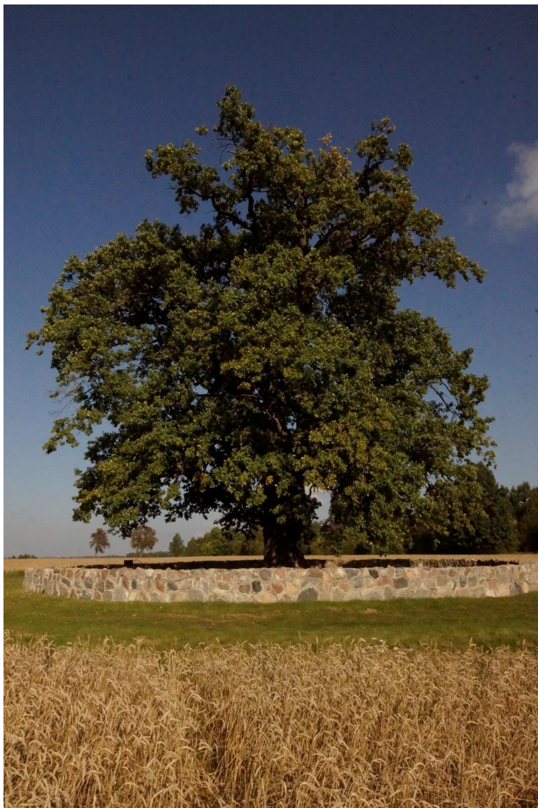
Рис. 1 Памятник природы регионального значения «Дуб черешчатый»