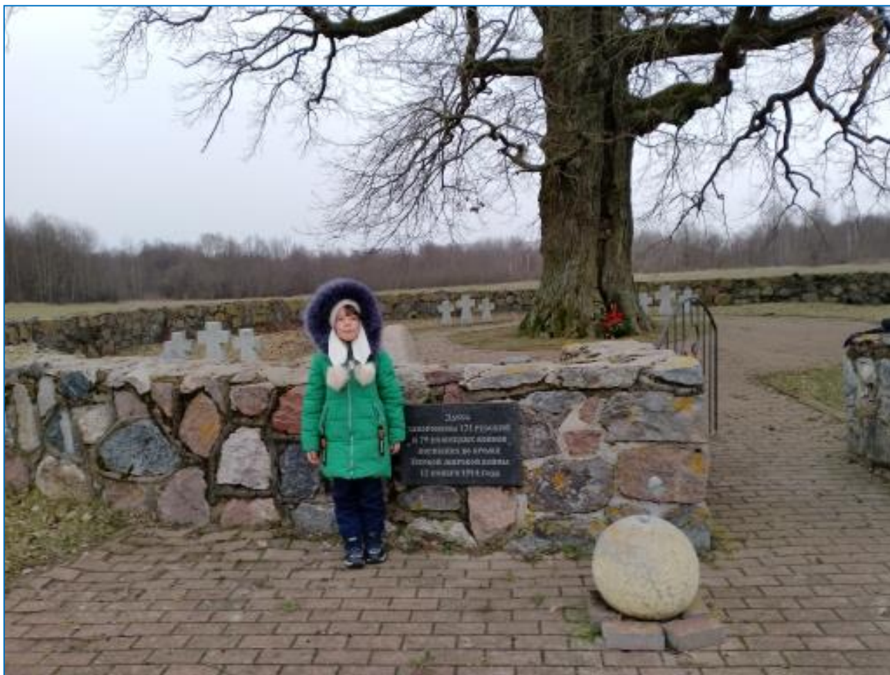
Рис.6 Я у знаменитого дуба